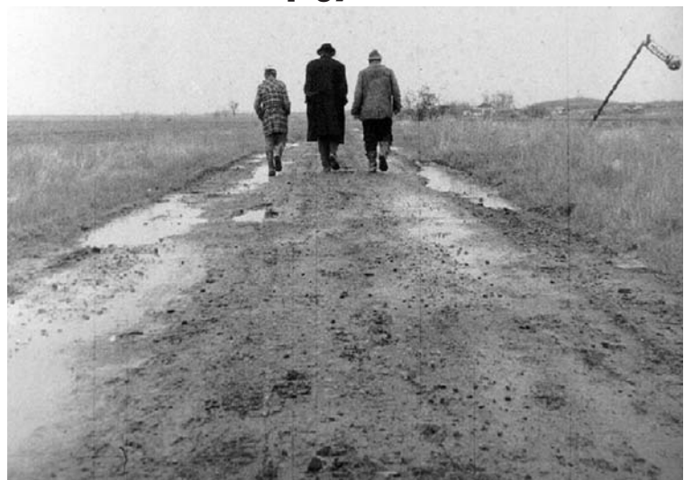
- Tessék mondani, a Sátántangó délelőtt hányszor megy?