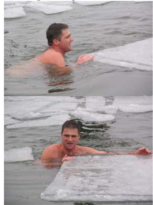
- Hátha két biztosító lesz!