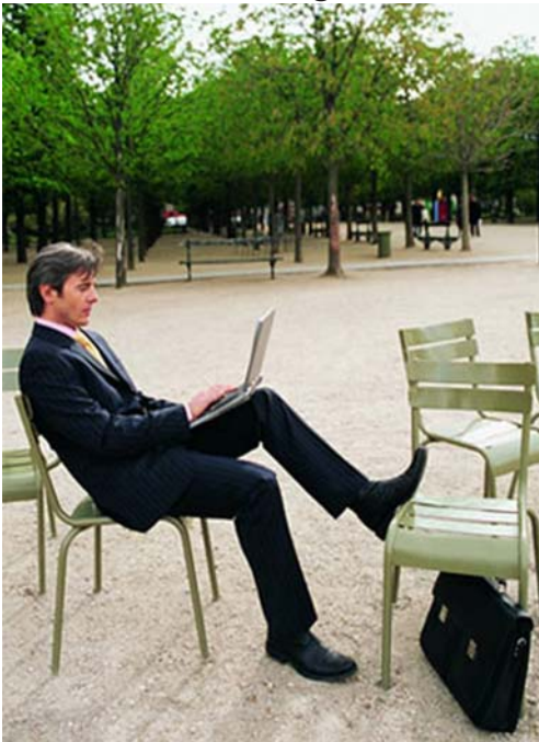
- Na, nézzük, kivel legyen randevúm!