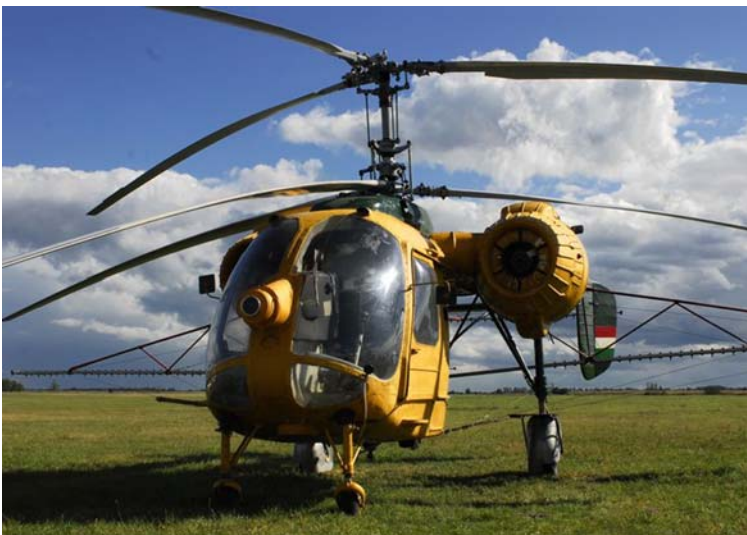
- Lepermetezem a kertünket szúnyogirtóval!