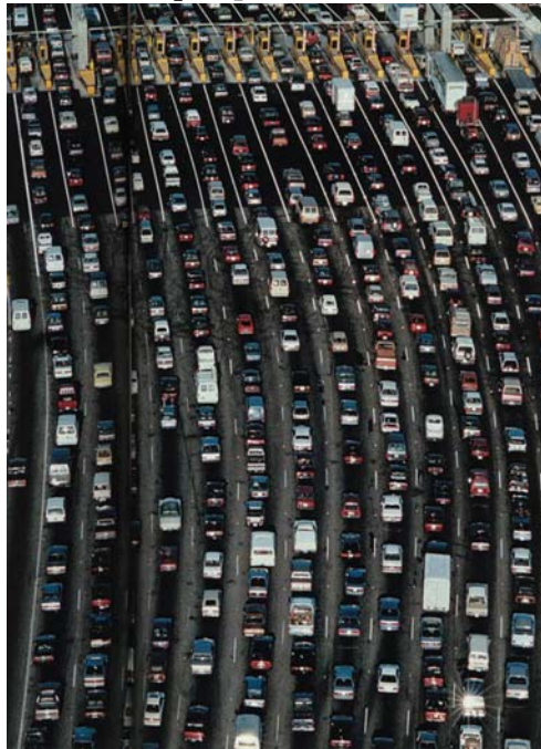
- Szívem, ez biztos az M0-s?