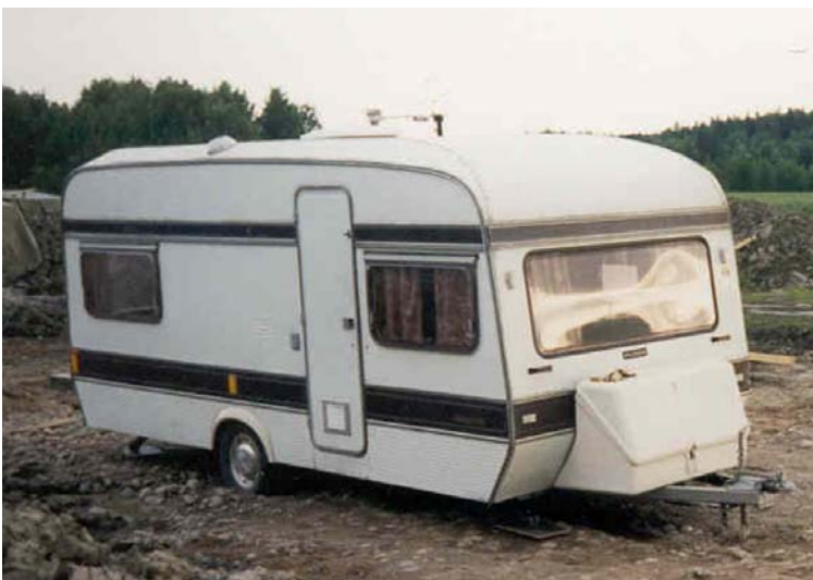
- Most stoppolhatok vele két hétig!